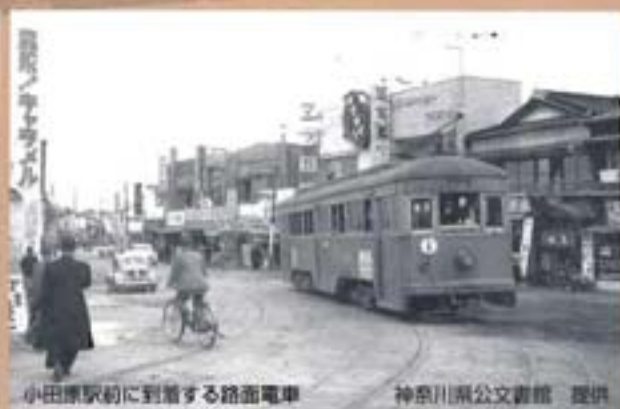
小田原駅前に到着する路面電車